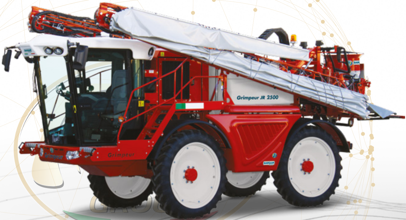
GRIMPEUR JR 2000-2500-3000