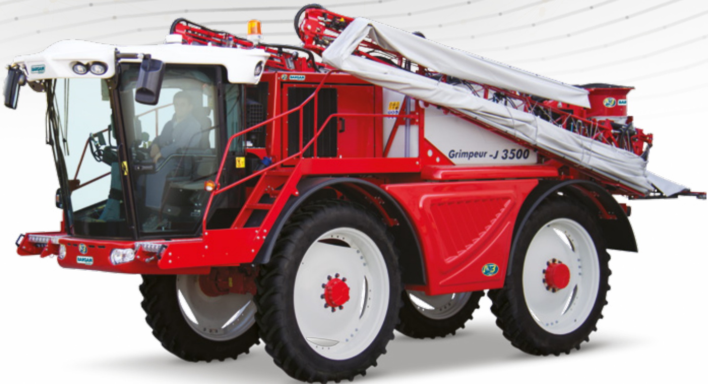
GRIMPEUR J 3000-3500-4000