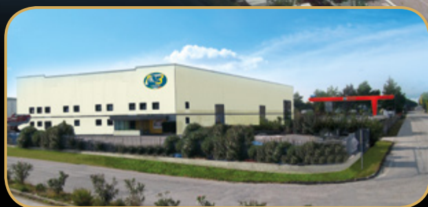
Manduria (Taranto) Stabilimento produttivo